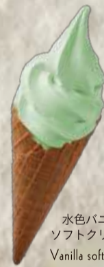
水色バニラソフトクリーム Vanilla soft cream