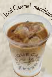
キャラメルマキアート 焦糖玛琪朵 ¥480