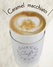
キャラメルマキアート 焦糖玛琪朵 ¥480