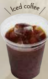
アイスコーヒー 冰咖啡 ¥380