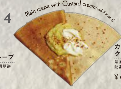
カスタードクリームクレープ (アーモンド入) 法国echire黄油与砂糖可丽饼配蛋奶油 (包含杏仁果) ¥630