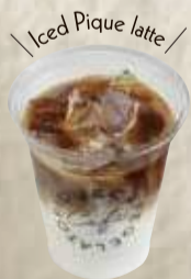
ピケラテ 拿铁 ¥430