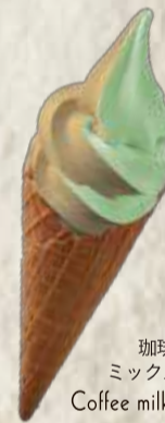
珈琲牛乳×バニラ ミックスソフトクリーム Coffee milk and Vanilla soft cream