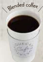
ブレンド 黒咖啡 ¥380

グアテマラ産コーヒー豆をベースに、独自にブレンドしたピケカフェのオリジナルブレンドです。