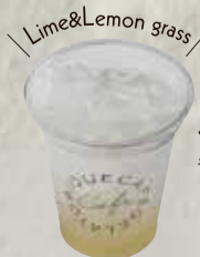
ライム&レモングラス 青柠檬&柠檬草 ¥480

甘味料・香料・着色料・保存料を一切使用していない、コーディアルシロップを使用したソーダです。