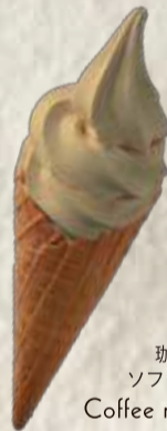
珈琲牛乳ソフトクリーム Coffee milk soft cream

「守山乳業」とのコラボソフト。当時の珈琲牛乳の味を復刻させた珈琲牛乳ソフトクリームとピケカフェのコラボソフト。カップかコーンからお選びいただけます。Please choose a cup or a cone.