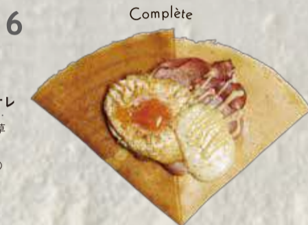
コンプレ ・たまご・チーズ・ハム 咸味可丽饼 (鸡蛋, 芝士, 火腿) ¥690