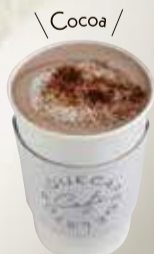
ココア 可可 ¥480