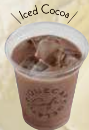
ココア 可可 ¥480