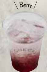
ベリー 浆果 ¥480