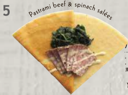
パストラミビーフのサレ ・パストラミ・ほうれん草 ・チーズ 黒牛肉&菠菜咸味可丽饼 (菠菜, 烟熏牛肉片, 芝士) ¥690

お食事に合うオリジナルクレープ生地に、様々な具材をとろけるチーズと共に包みました。手軽に食べられる、食べごたえのあるクレープサレです。熱々を召し上げれ。