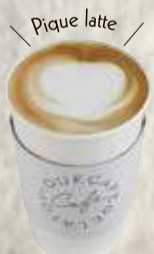
ピケラテ 拿铁 ¥430