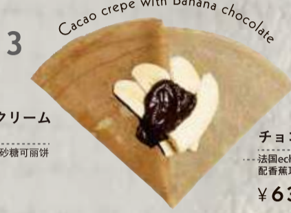
チョコバナナクレープ 法国echire黄油与巧克力可丽饼配香蕉巧克力 ¥630