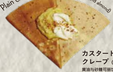
4 Plain crepe with custard cream (and almond)

カスタードクリームクレープ (アーモンド入) 黄油与砂糖可丽饼配蛋奶油 (包含杏仁果) ¥590 (+tax)