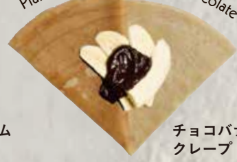
3 Plain crepe with banana chocolate