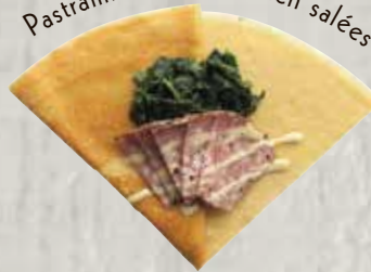
5 Pastrami beef & spinach salées

パストラミビーフとほうれん草のサレ ・パストラミビーフ ・ほうれん草・チーズ 黒牛肉&菜菔風味可丽饼 (菜菔・燻熏牛肉片・芝士) ¥640 (+tax)