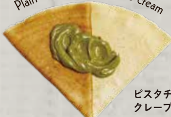
2 Plain crepe with pistachio cream